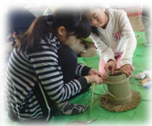
親子や友達同士で感動を共有し、オリジナルの作品に大満足!!

参加者からは、「親子で共通体験し、感動を共有できたことが素晴らしかった。」「3回目の参加が一番良い出来だった。」「屋食のカレーや巨大マシュマロ焼きがおいしかった。」など、うれしい感想がたくさん寄せられました。来年度もたくさんの方のご参加をお待ちしています。