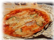
かまど焼き ピザ作り