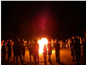
キャンプファイヤー