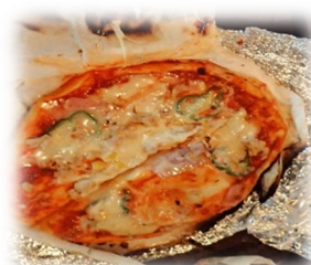
かまど焼き ピザ作り