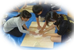
手打ちうどん作り