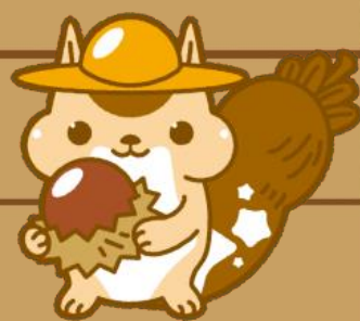
朝日少年自然の家オリジナルキャラクター プラたん